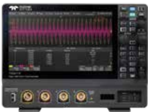
12ビット高分解能オシロスコープ T3DSO2000HD シリーズ