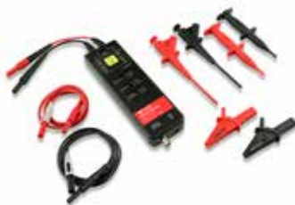
最大1.5kV高電圧差動プローブ T3HVD シリーズ